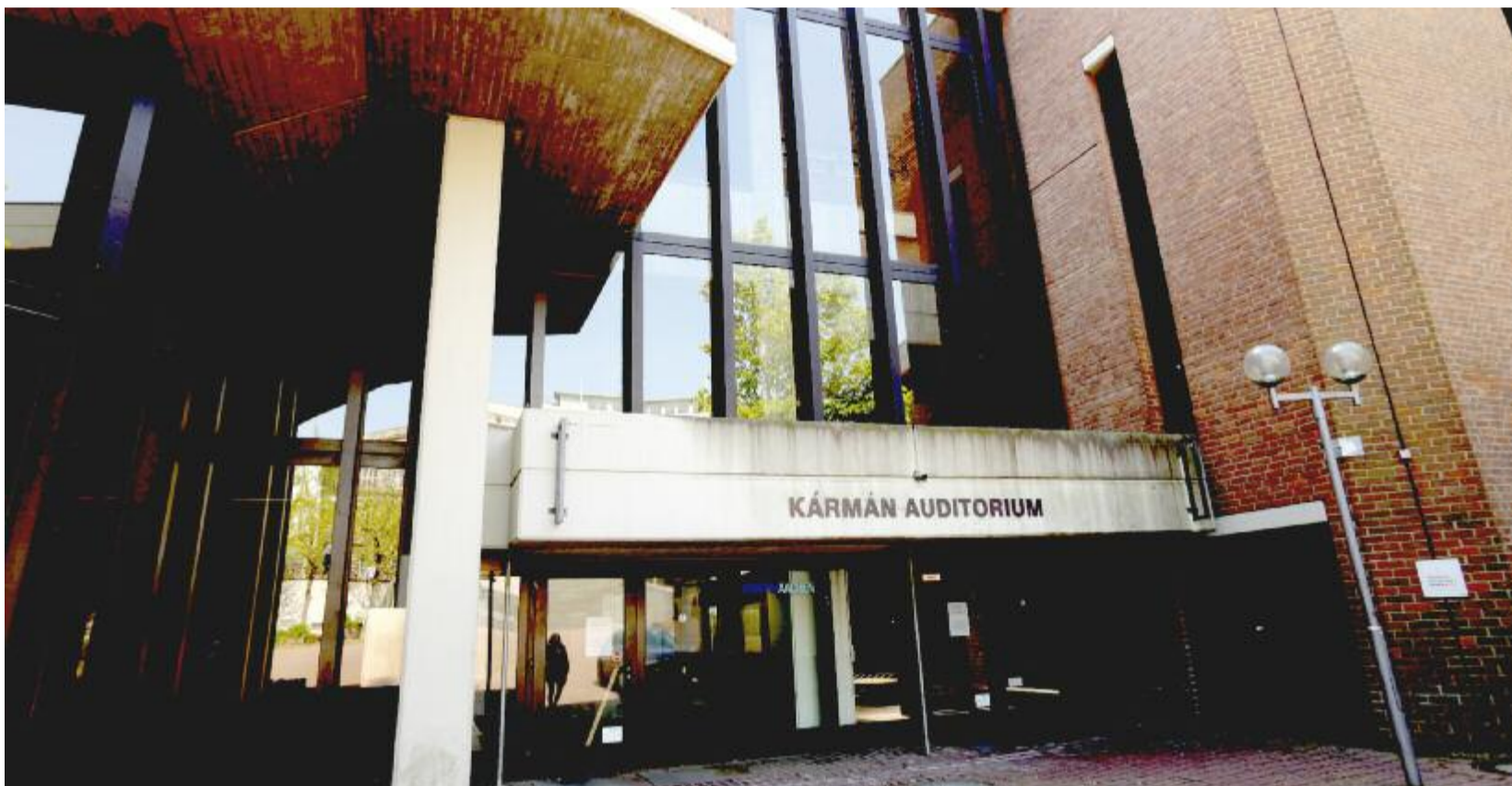
Das Kármán-Auditorium.

Der Sanierungsmarathon um Audimax, Hauptgebäude und Kármán Auditorium