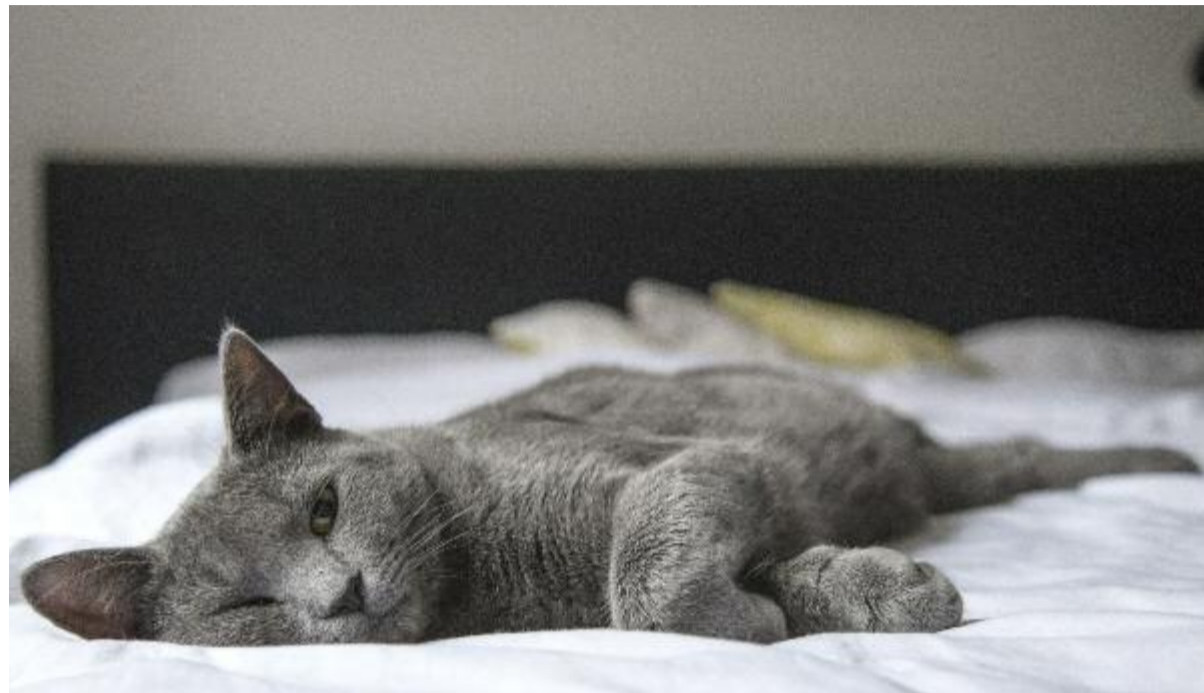
Langzeitstudenten wirken nach außen oftmals fauler, als sie eigentlich sind.

10% aller Studierenden aus NRW gelten als Langzeitstudenten