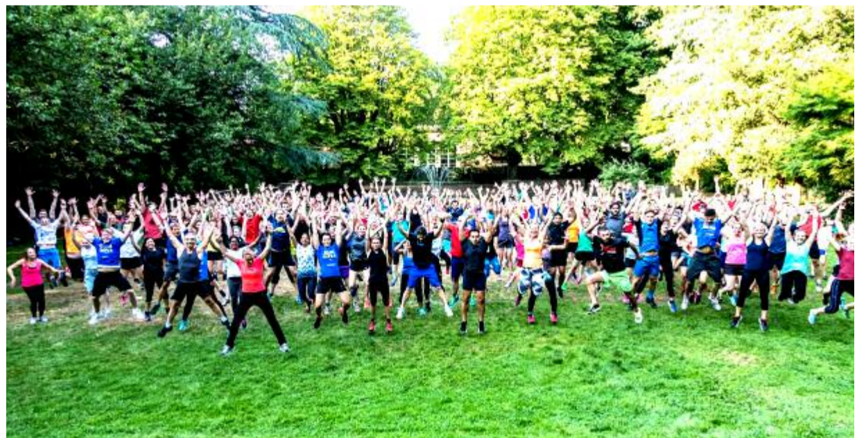
Teilnehmerrekord bei Sport im Park 2017.

Ob man in Kleingruppen trainiert oder mit 150 anderen Yogis den Sonnengruß performt, hier ist für jeden das Richtige dabei. „Um noch mehr Menschen in die Parks zu locken, wurde die Anzahl der Sportkurse von 450 auf circa 500 erweitert.“, sagt Ortsmann. Unter anderem werden