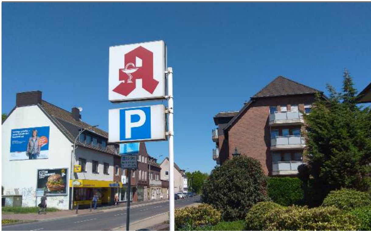
Der Arbeitsalltag einer PKA ist vielseitiger als gedacht.

Unsere Redakteurin ist gelernte PKA und erzählt von ihrem Berufsalltag